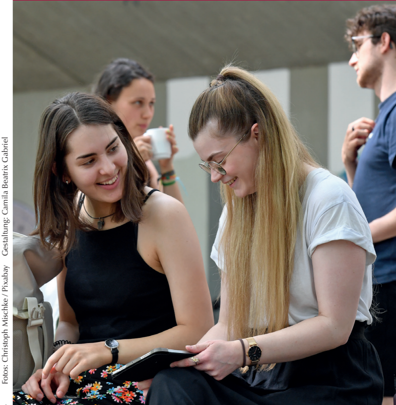
Gestaltung: Camilla Beatrix Gabriel