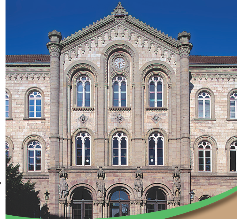
Hafke · medien design

Rechtliche Interessenkonflikte zwischen Kommunen und Landwirtschaft