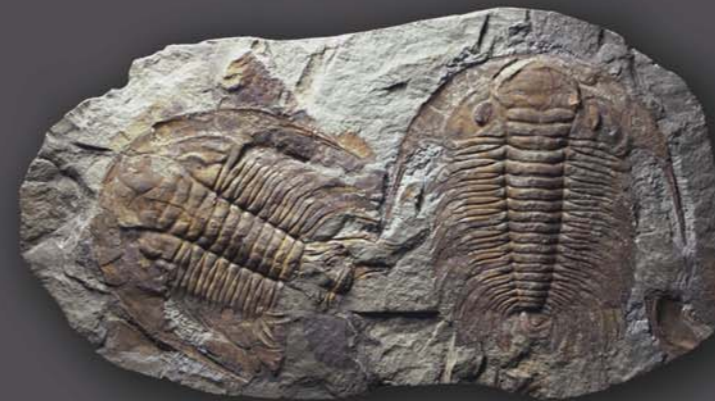
Mittelkambrische Dreilapp-Krebse (Trilobiten) – angekauft mit Mitteln des Fördervereins

E-mail: dtrzeci@gwdg.de (Vorsitzender: Dr. D. Trzeciok)