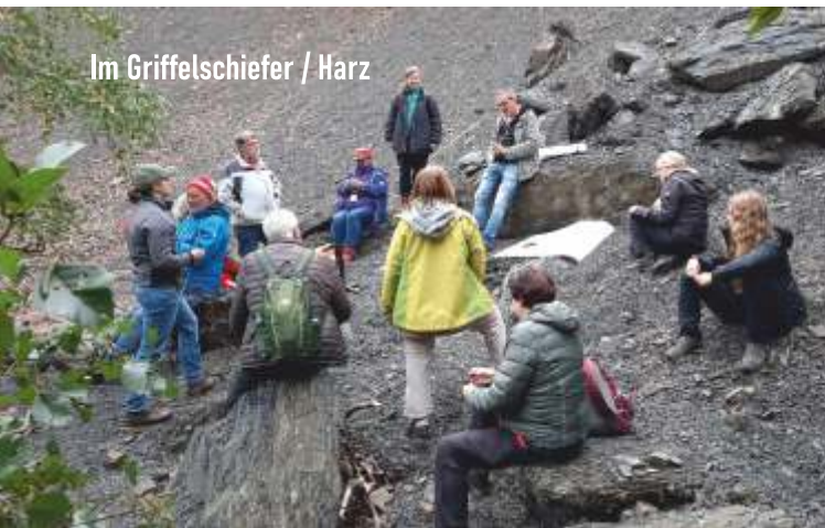
Im Griffelschiefer / Harz

Wir empfinden das Verständnis unserer Erde als eine wesentliche Voraussetzung für einen sensiblen Umgang mit unserer Lebensgrundlage, die durch Klimawandel, Umweltzerstörung und die Ausbeutung begrenzter Ressourcen akut bedroht ist.