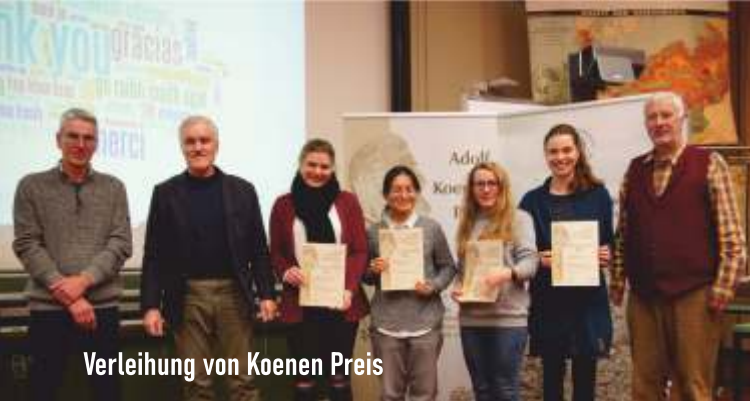
Verleihung von Koenen Preis