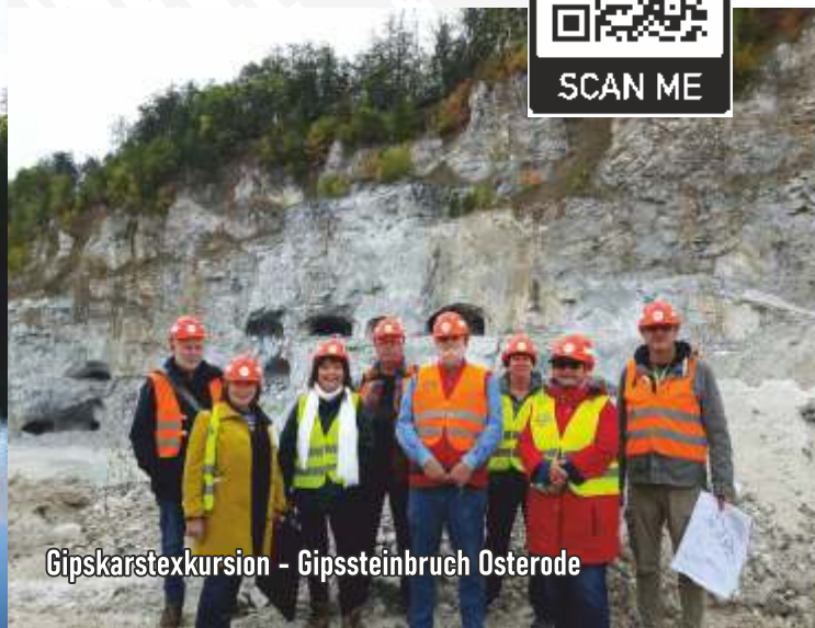
Gipskarstexkursion - Gipssteinbruch Osterode