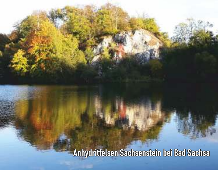
Anhydritfelsen Sachsenstein bei Bad Sachsa