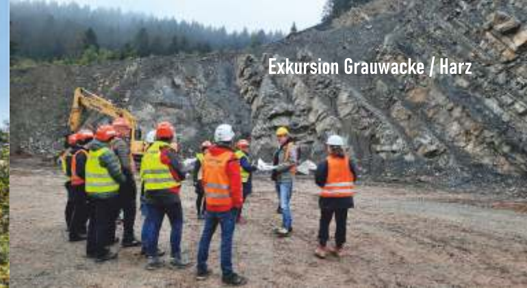
Exkursion Grauwacke / Harz