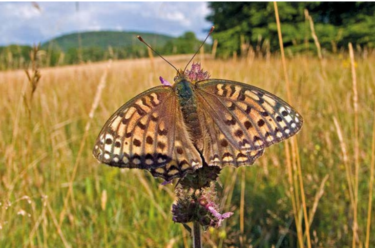
Perlmutterfalter im Exploratorium auf der Schwäbischen Alb

gemeinschaften und ihre Beziehungsgeflechte sowie die Ökosystemdienste, die sie bereitstellen. Das Ziel: Wissenschaftliche Grundlagen zu schaffen für die nachhaltige Nutzung des natürlichen Ökosystems Tropischer Bergregenwald und seiner anthropogenen Ersatzsysteme, zum Beispiel der Weideflächen. Durch Verbesserung dieser Ersatzsysteme kann der Naturwald vor weiterer Rodung bewahrt und zugleich den Bedürfnissen der Landbevölkerung Rechnung getragen werden.