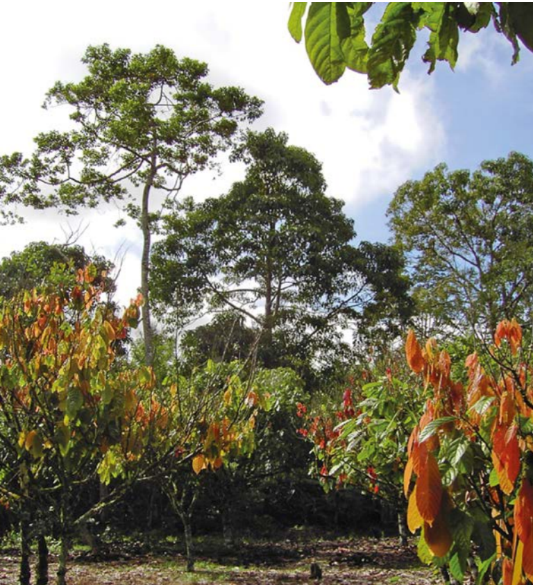
Um gut zu gedeihen, brauchen Kakaopflanzen (Vordergrund) Schattenbäume.

Bergregenwaldes und tragen so zur Steigerung der Artenvielfalt bei.