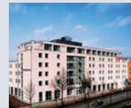
Das InterCityHotel Göttingen liegt zentral.

InterCityHotel Göttingen Bahnhofsallee 1a 37081 Göttingen Tel. 0551/52 11-0 Fax 0551/52 11-500 E-Mail: goettingen@intercityhotel.de