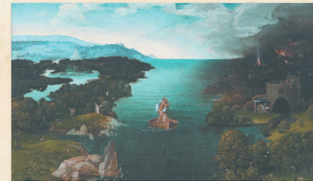
In his most famous work »Landscape with Charon crossing the Styx« the Flemish painter Joachim Patinir (ca. 1480-1524) depicts Charon ferrying a human soul who must choose between Heaven and Hell. It is worth noting that the representation of this classical scene draws on both mythological (Cerberus, the river Lethe), as well as Christian iconography (angels, churches in the distance). The painting is currently held by the Museo Nacional del Prado in Madrid, Spain.