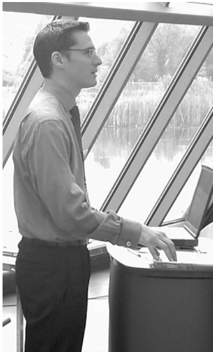
Eine optimale Selbstdarstellung ist gerade für Generalisten, wie Geografen wichtig

In den auslaufenden Diplom-Studiengängen mussten die Geografen noch sechs Monate lang Pflichtpraktika absolvieren. In der neuen Welt der Bachelor- und Masterstudiengänge sei diese Zeit des Sich-Ausprobierens auf sechs Wochen zusammengeschrumpft. Zu wenig, sagen Praktiker wie Veres. Die Einführung