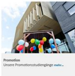
Promotion Unsere Promotionsstudiengänge mehr...