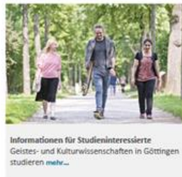
Informationen für Studieninteressierte Geistes- und Kulturwissenschaften in Göttingen studieren mehr...