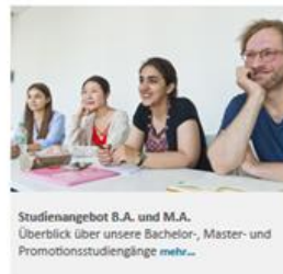
Studienangebot B.A. und M.A. Überblick über unsere Bachelor-, Master- und Promotionsstudiengänge mehr...